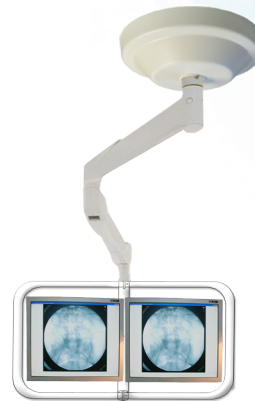
ESI026 Suspension 2 écrans