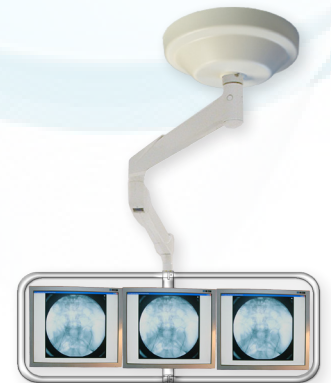
ESI027 Suspension 3 écrans