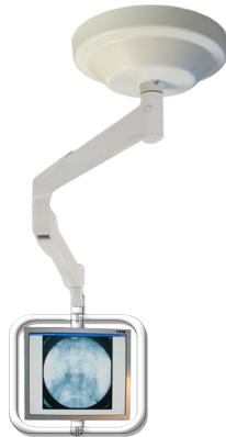
ESI025 Suspension 1 écran